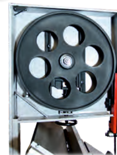
Führungsräder bei HBS610