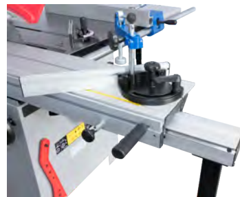
Gehrungsanschlag mit Niederhalter