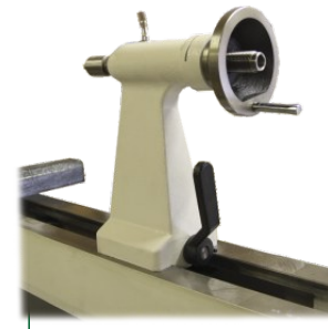
Reitstock mit Schnellverspannung