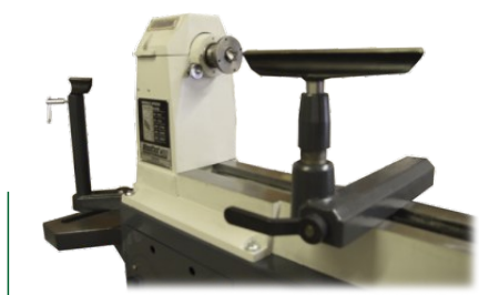
Handauflage m. Schnellverschluss