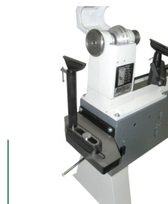
Außendrehvorrichtung als Option